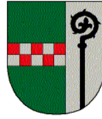
Jerzens St. Leonhard i. P.